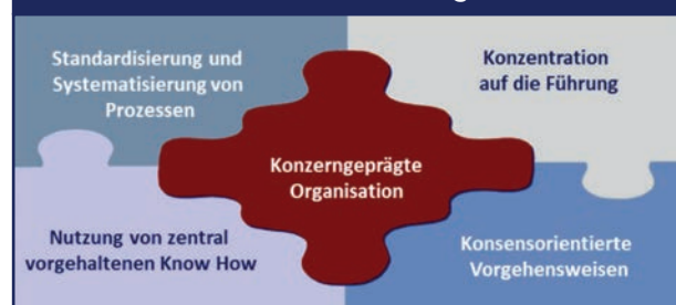
Abb. 2: Prozessuale Zusammenhänge im Konzern

Der Mittelstand denkt deutlich weniger in Prozessen, sondern eher in Aufgabeninhalten. Es bleibt dem einzelnen Mitarbeiter